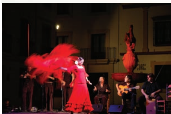
El flamenco se adueña de la noche cordobesa.