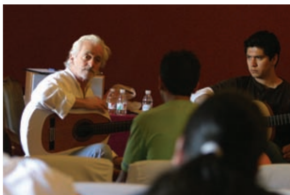
Manolo Sanlúcar imparte su maestría.

La XXV edición de la Cata del Vino Montilla-Moriles abrirá sus puertas del 7 al 11 de Mayo con la esperanza de seguir incrementando la interminable lista de personas que, aunque sólo sea por unos días, se acercan al oloroso, sabroso e inspirador mundo del vino.